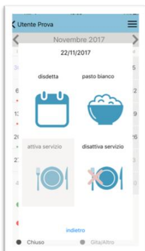
Sceita disdetta, pasto in bianco, Attivazione/disattivazione servizio