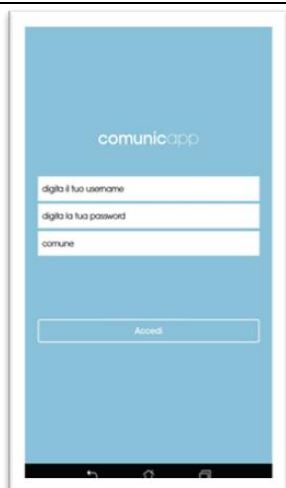
Login e scelta comune