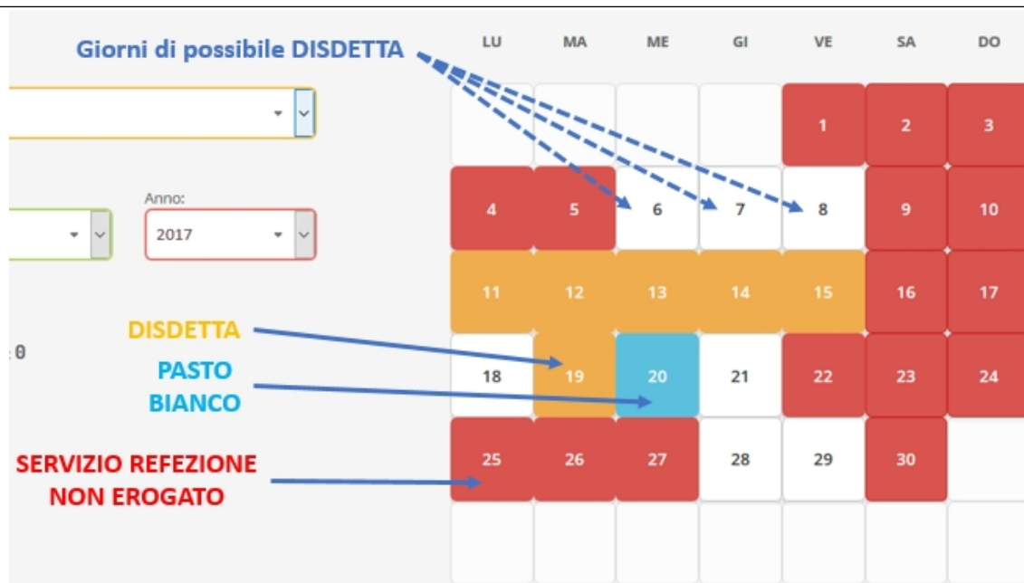
Portale Genitori 3 – Esempio di situazione presenze e disdette in calendario

Dipartimento Amministrativo-Finanziario/Servizi alla Persona Ufficio Servizi Scolastici