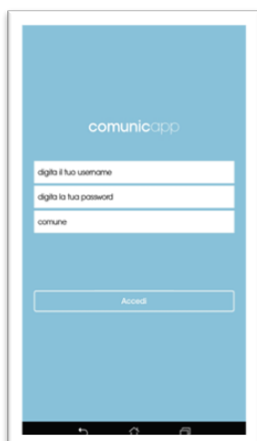
Login e scelta comune