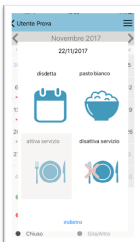
Scelta disdetta, pasto in bianco, Attivazione/disattivazione servizio